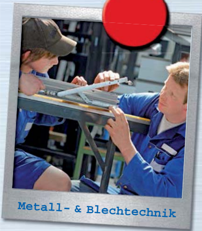
Metall- & Blechtechnik

Das Beste an meinem Job ist, dass ich jeden Tag was Neues erlebe.